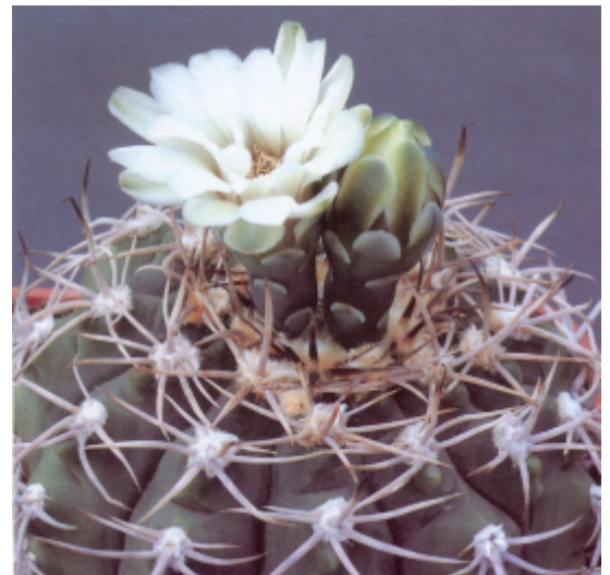
Gymnocalycium castellanosii ssp. castellanosii

G. carminanthum a aussi évolué, mis en synonymie avec ses proches parents G. tillianum et G. oenanthum . Ce dernier a priorité, nous en saurons donc plus lorsque nous en serons à la lettre 'O' ; mais une fois encore pour échantillon, nous vous proposons une photo.